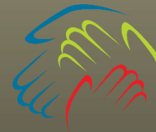
Table autonome des AÎNÉS des Collines Des Collines SENIORS' Roundtable