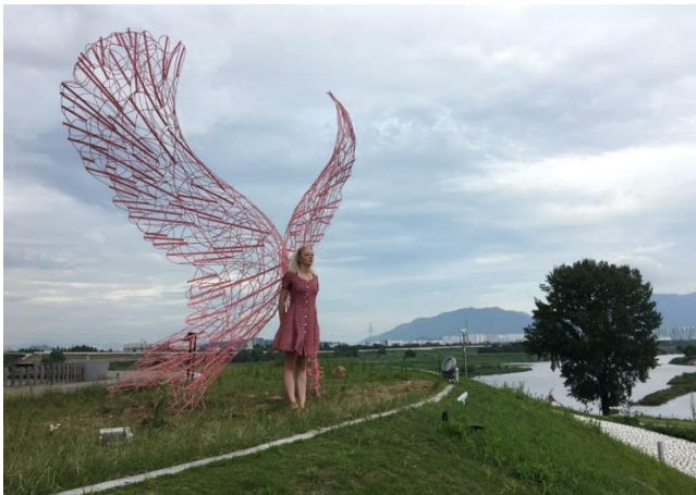
I believe I can fly , œuvre de Gleb Dusavitskiy, sculpteur russe

Ce sont les œuvres de Gleb Dusavitskiy du Danemark pour son projet « I believe I can fly » ainsi que celle de Stéphane Langlois de Neuville au Québec avec son projet « Les pères et le Froment » qui ont finalement été sélectionnées. Les deux artistes ont jusqu'au mois de septembre 2021 pour compléter et installer leurs œuvres respectives. L'inauguration officielle du Sentier des Arts est prévue le 18 septembre 2021.